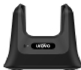
Зарядна станція (Cradle)